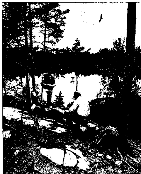
Rast vid sjön Ålskaren någonstans längs Sörmlandsleden.