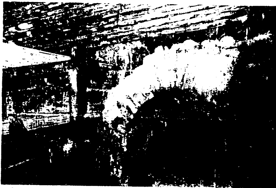
Inuti pörtet finns den gamla eldstaden bevarad och i taket hänger det krokar att hänga kött på.